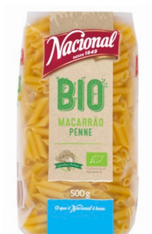
MACARRÃO BIO . ORGANIC PENNE