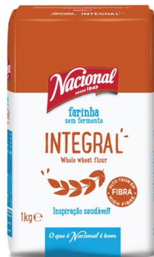
INTEGRAL . WHOLE WHEAT FLOUR