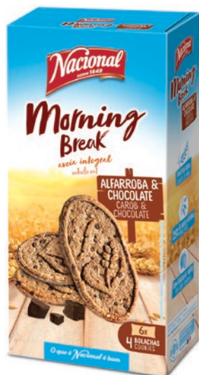
MY MORNING BREAK ALFARROBA E CHOCOLATE