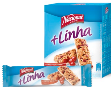
+ LINHA FRUTOS VERMELHOS