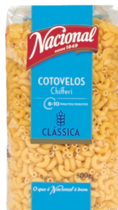
COTOVELOS . CHIFFERI