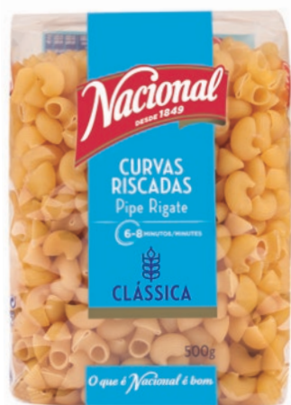
CURVAS RISCADAS . PIPE RIGATE