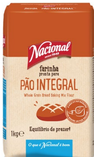
FARINHA PÃO INTEGRAL WHOLE GRAIN BAKING FLOUR