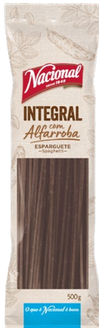
ESPARGUETE INTEGRAL COM ALFARROBA WHOLE WHEAT SPAGHETTI WITH CAROB