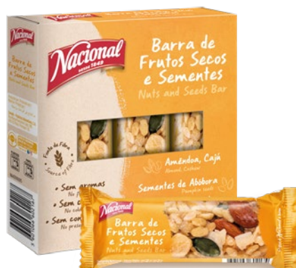
BARRAS DE FRUTOS SECOS E SEMENTES NUTS AND SEEDS BARS