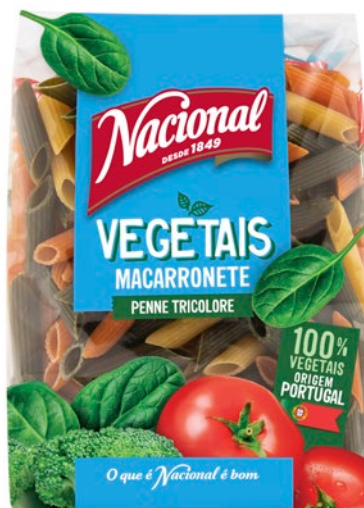
MACARRONETE COM VEGETAIS . PENNE TRICOLERE

🕒 500 g ||||| 560 1066 301 787 📅 36 meses