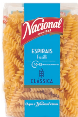
ESPIRAIS . FUSILLI