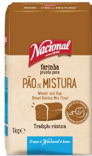
FARINHA PÃO MISTURA WHEAT AND RYE BAKING MIX FLOUR