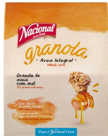
GRANOLA DE MEL HONEY GRANOLA