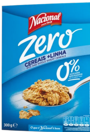
+ LINHA ZERO