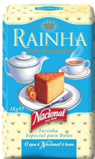
RAINHA . SELF RISING FLOUR