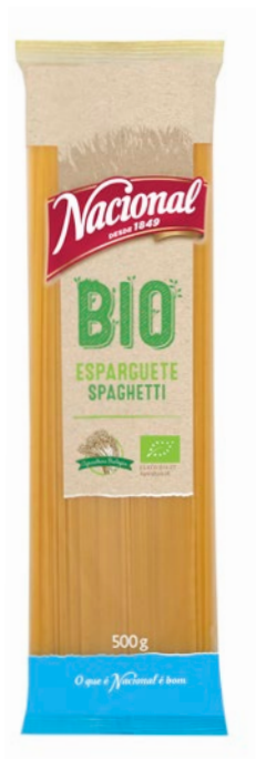
ESPARGUETE BIO . ORGANIC SPAGHETTI