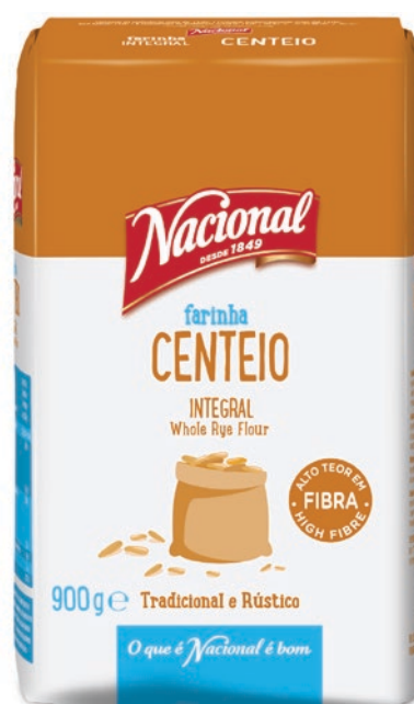
FARINHA CENTEIO INTEGRAL WHOLE RYE FLOUR