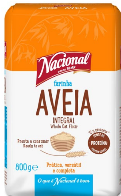
FARINHA AVEIA INTEGRAL WHOLE OAT FLOUR