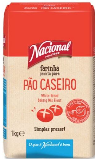
FARINHA PÃO CASEIRO WHITE BREAD BAKING MIX FLOUR