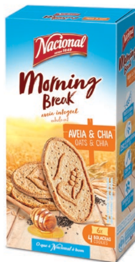
MY MORNING BREAK AVEIA E CHIA