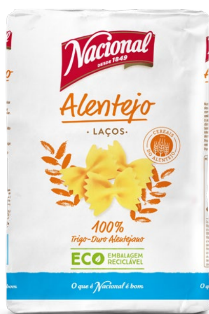
LAÇOS ALENTEJO ECO FARFALLE ALENTEJO ECO