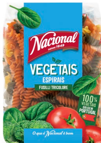
ESPIRAIS COM VEGETAIS . FUSILLI TRICOLERE

🕒 500 g ||||| 560 1066 302 289 📅 36 meses