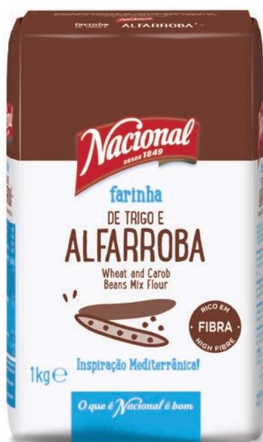
FARINHA TRIGO E ALFARROBA WHEAT AND CAROB BEANS FLOUR