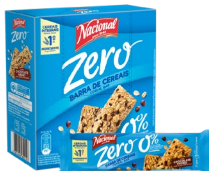
BARRAS DE CEREAIS ZERO