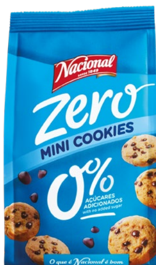
MINI COOKIES ZERO