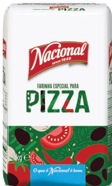
FARINHA ESPECIAL PARA PIZZA . PIZZA FLOUR