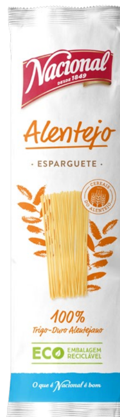
ESPARGUETE ALENTEJO ECO SPAGHETTI ALENTEJO ECO