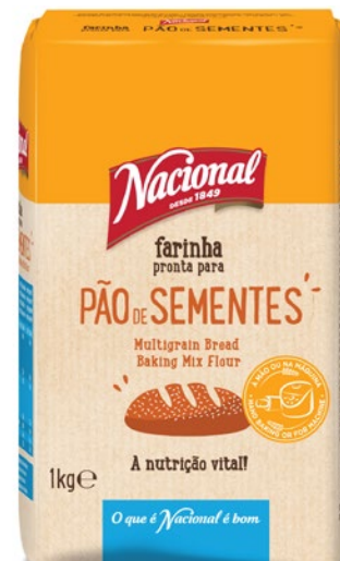
FARINHA PÃO SEMENTES MULTIGRAIN BREAD BAKING MIX FLOUR