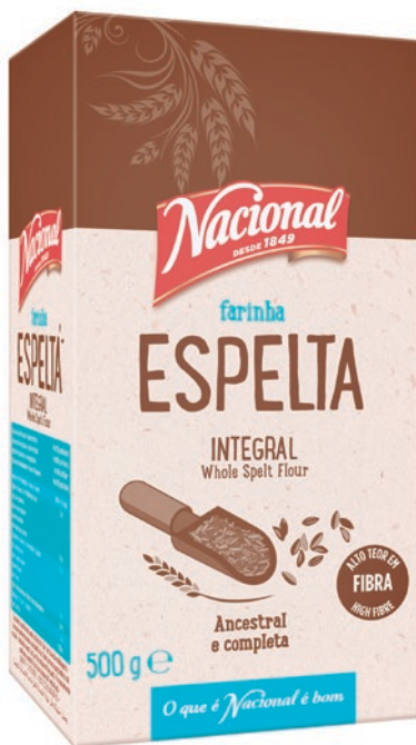
FARINHA ESPELTA INTEGRAL WHOLE SPELT FLOUR