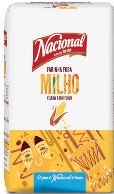
FARINHA FUBA DE MILHO . YELLOW CORN FLOUR