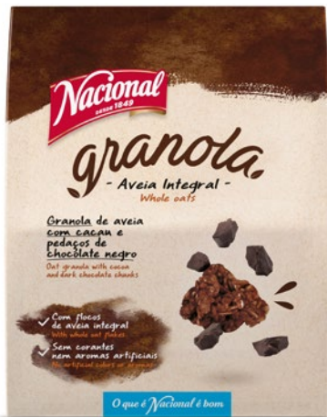
GRANOLA DE CACAU E CHOCOLATE COCOA AND CHOCOLATE GRANOLA