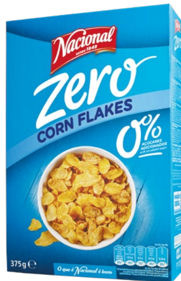
CORN FLAKES ZERO