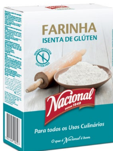
FARINHA ISENTA DE GLÚTEN . GLUTEN FREE FLOUR