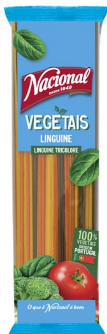
LINGUINE COM VEGETAIS . LINGUINE TRICOLERE

🕒 500 g ||||| 560 1066 302 289 📅 36 meses