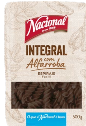
ESPIRAIS INTEGRAIS COM ALFARROBA WHOLE WHEAT FUSILLI WITH CAROB