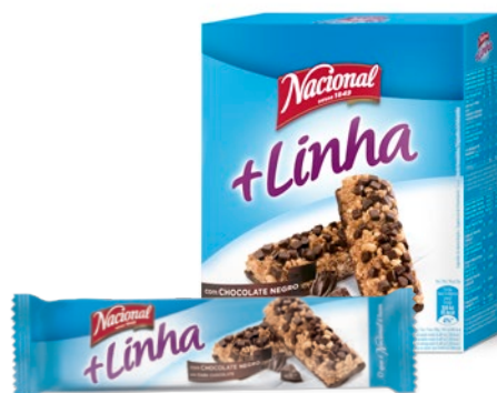
+ LINHA CHOCOLATE